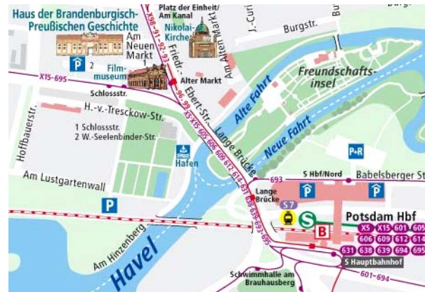
Karte: Kontur GbR

Tagungsgebühr für den 23. und 24. Mai inklusive Getränke und Imbiss: 10,- €, Studierende: Teilnahme frei